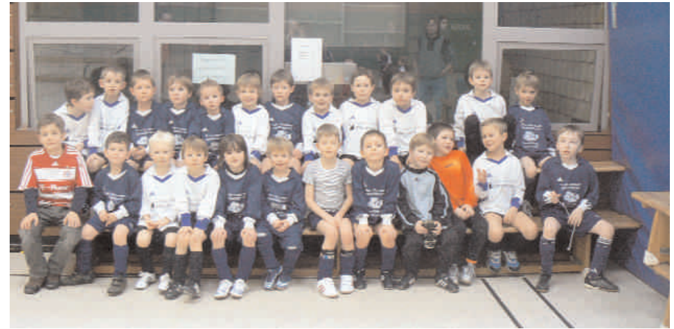
Motivierter „Haufen“: Rund 40 Kinder spielen derzeit in der G-Jugend des Tuspo Heroldsberg. Ihr Können zeigen die jüngsten Nachwuchs-Kicker bei organisierten Turnieren.

Derzeit trainieren etwa 40 Kinder im Alter zwischen vier und sechs Jahren freitags zwischen 17 und 18 Uhr auf dem Sportplatz.