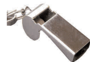
Der Pfiff im Kick S. 9